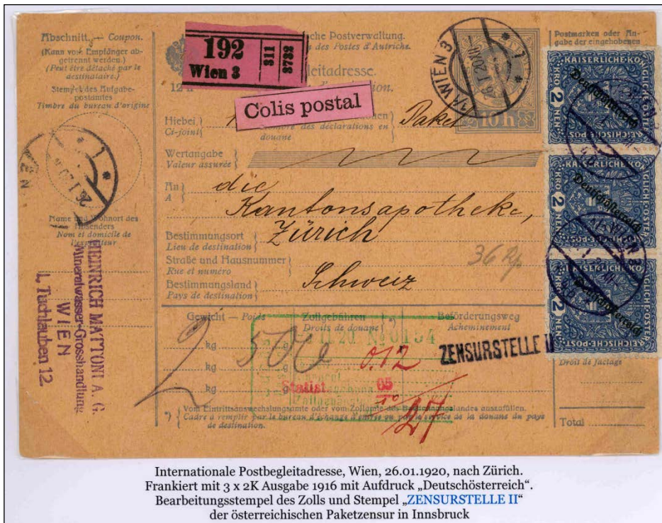
Internationale Postbegleitadresse, Wien, 26.01.1920, nach Zürich. Frankiert mit 3 x 2K Ausgabe 1916 mit Aufdruck „Deutschösterreich“. Bearbeitungsstempel des Zolls und Stempel „ZENSURSTELLE II“ der österreichischen Paketzensur in Innsbruck